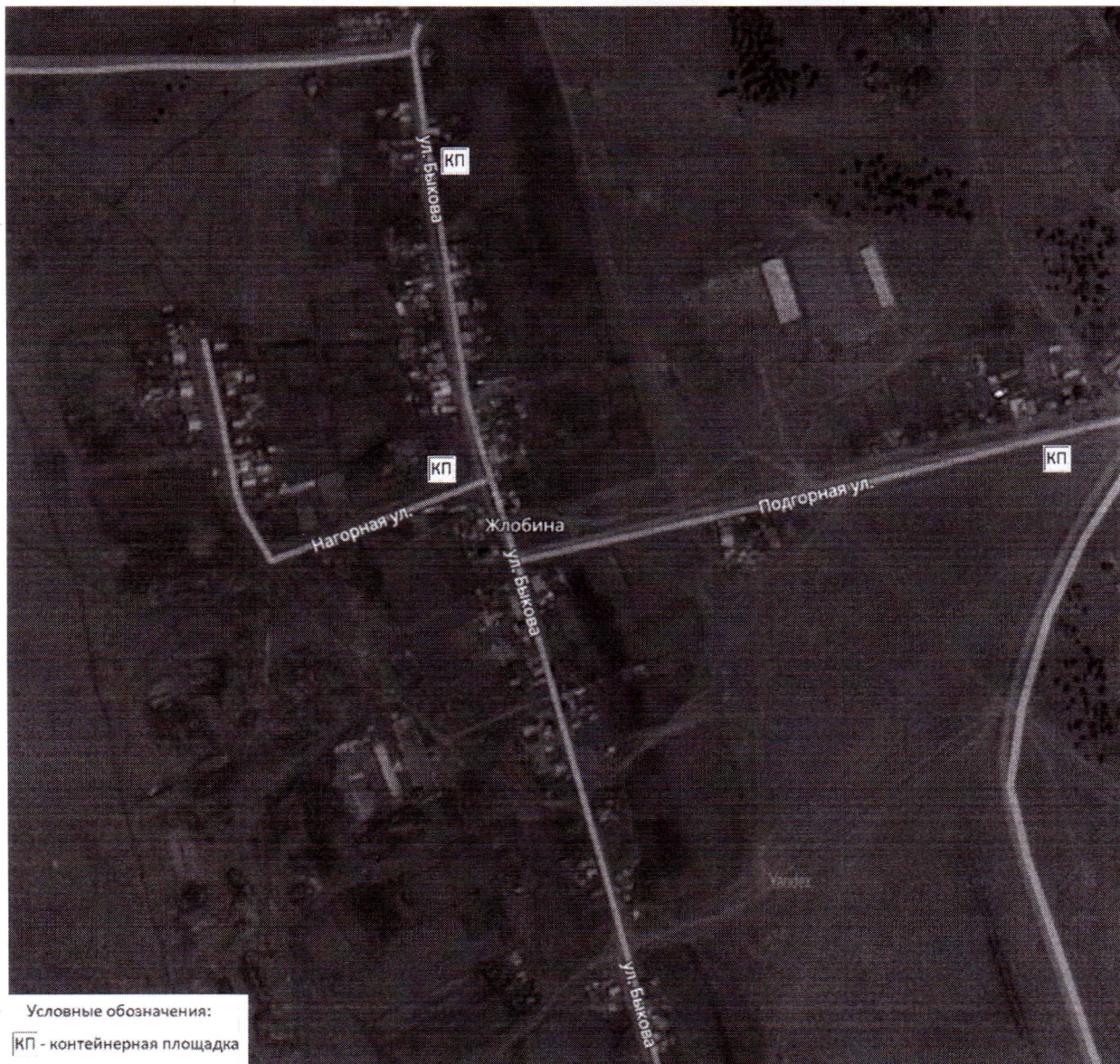
Рисунок 2. Схема размещения мест накопления твердых коммунальных отходов на территории д. Жлобина