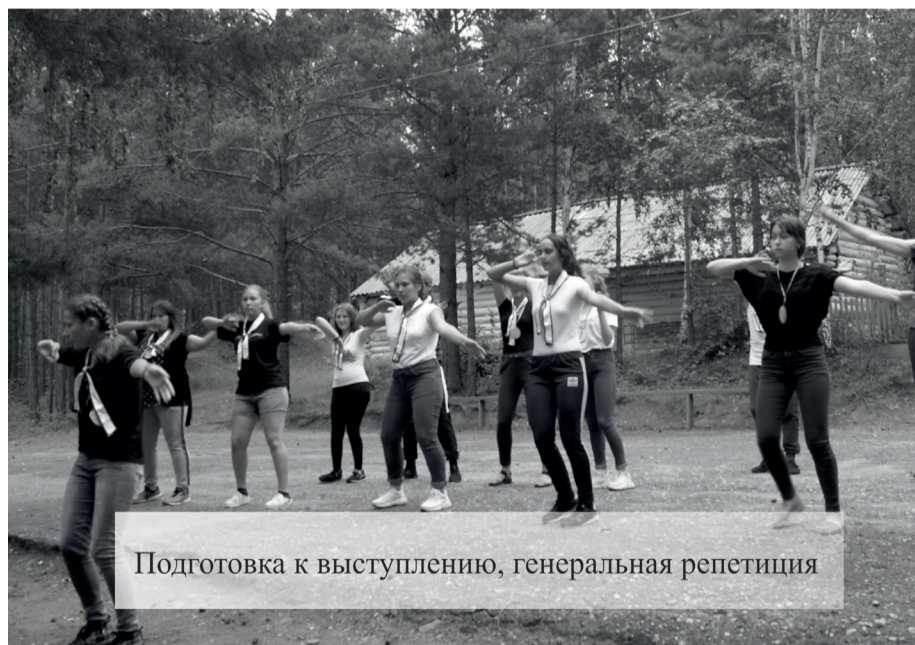
Подготовка к выступлению, генеральная репетиция

Уже завтра наступит последний, третий день фестиваля. Будут подведены итоги мероприятия, и ребята передадут свои проекты по изменению и улучшению лагеря «Лена» администрации района. А еще завтра откроется выставка прикладного искусства, на которой будут представлены экспонаты, выполненные руками ребят.