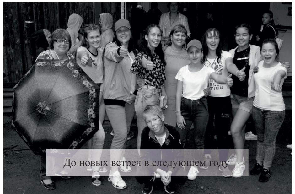
До новых встреч в следующем году

Хоть и не было на нашем фестивале победителей и проигравших, всем вручили полезные подарки - большую энциклопедию и бренд нашей территории – магнит с изображением Храма Святителя Иннокентия (Вениаминова). А еще ввели новую традицию - завели