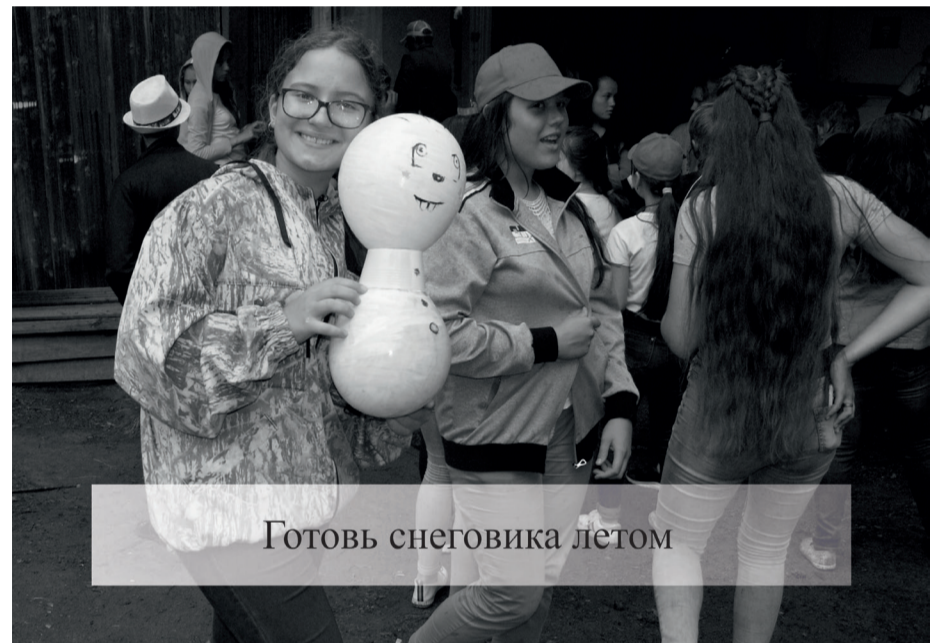
Готовь снеговика летом

Хоть и не было на нашем фестивале победителей и проигравших, всем вручили полезные подарки - большую энциклопедию и бренд нашей территории – магнит с изображением Храма Святителя Иннокентия (Вениаминова). А еще ввели новую традицию - завели