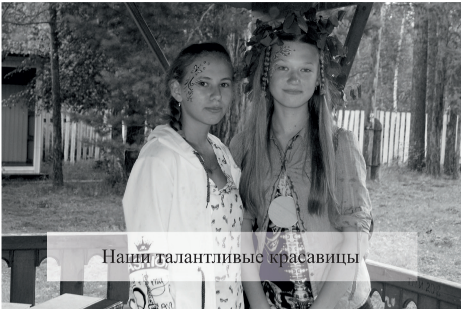
Наши талантливые красавицы