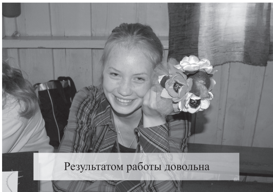
Результатом работы довольна

В лагерь приехало много одаренных деток и уже завтра они покажут много различных мастер-классов. Ребята смогут научиться друг у друга многим полезным и увлекательным вещам.