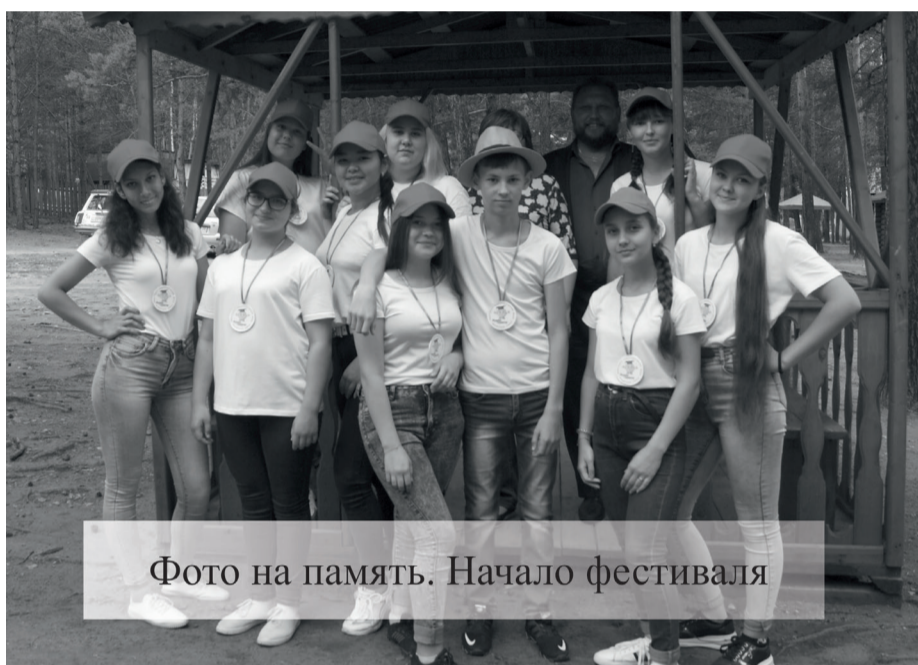
Фото на память. Начало фестиваля

16 июля в летнем лагере «Лена» стартовал трехдневный фестиваль детского творчества одаренных детей «Родник талантов - 2019». Его целью является использование малозатратной формы преобразования лагеря и объединение ребят из разных школ района, обмена опытом. На фестивале каждая команда готовит свой проект по преобразованию и улучшению лагеря. По окончании фестиваля все проекты предоставят в администрацию района. Далее они будут использованы в рамках летней оздоровительной кампании в 2020 году.