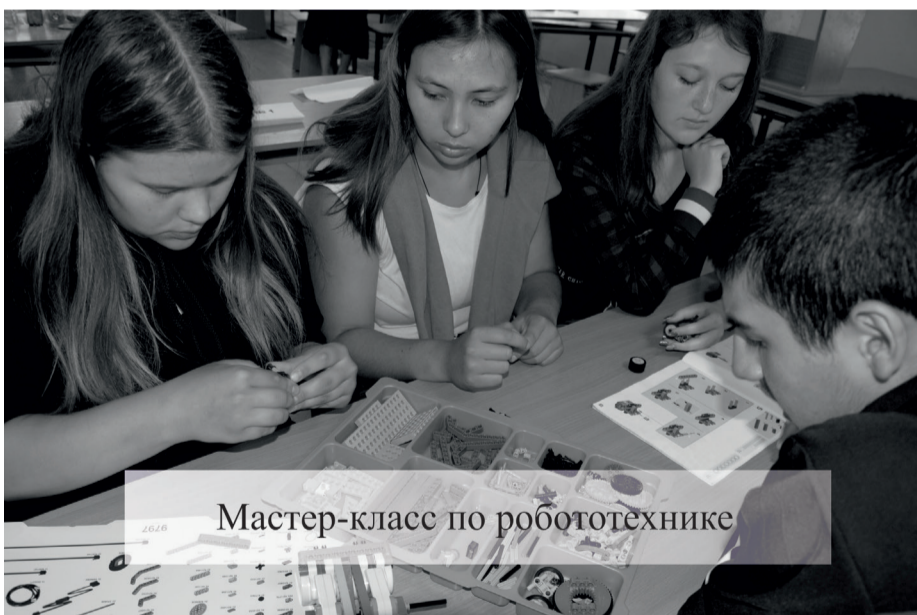
Мастер-класс по робототехнике

Кто такой талантливый человек? В проявлении таланта нет победителей. Каждый талантлив в своем направлении. Но, скажем просто и кратко, талантливые люди – это, несомненно, ученики школ нашего района, ставшие участниками ежегодного фестиваля «Родник талантов - 2019». Каждая команда - участница по-своему увидела и презентовала лагерь будущего. Много новых, интересных и креативных идей было представлено. Идей, которые просто необходимо воплотить в жизнь, тем более, что ребята готовы в этом помочь.