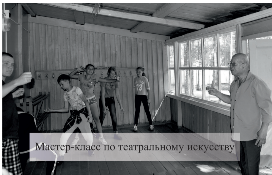
Мастер-класс по театральному искусству