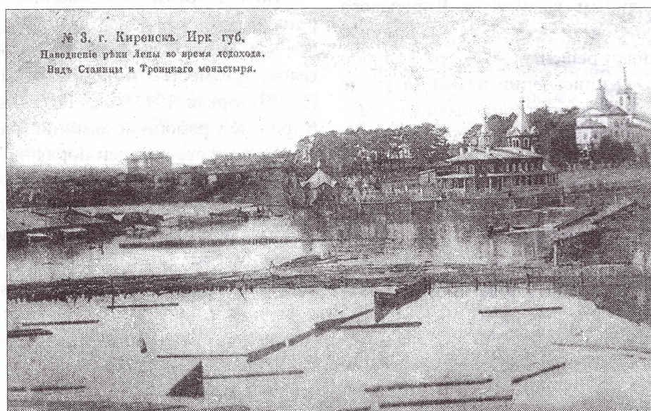
Нижняя поскотина в наводнение 1915 года.