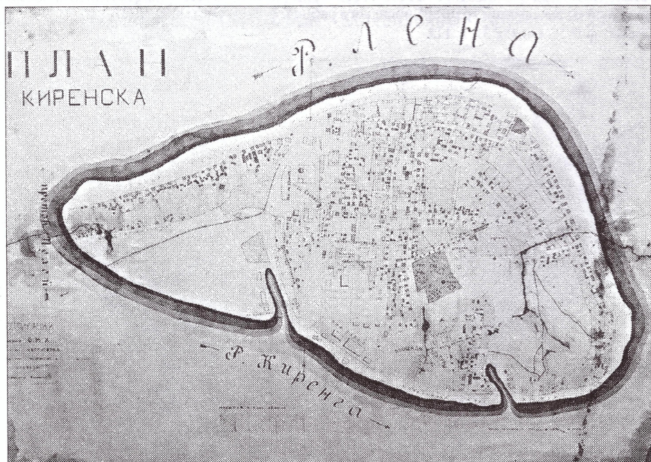
Карта города Киренска 1926 года

Совокупность топонимов или собственных названий географических мест города Киренска и Киренского района отражает историю заселения территории, особенности географического положения, рассказывает о событиях, значимых и не очень, и о людях, чьи дела потомки пожела-ли увековечить. Наряду с названиями офи-