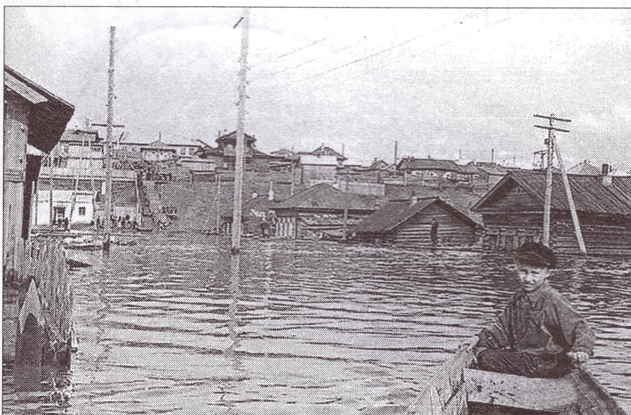
Вид лестницы в наводнение 1961 года