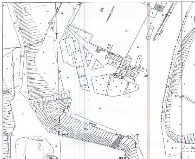
Схема размещения мест для продажи товаров на новогодней городской ярмарке по адресу: г. Железногорск-Илимский, кв-л 8, район Торгового Центра

к плану мероприятий по организации новогодней городской ярмарки и продажи товаров на ней, утвержденному постановлением администрации муниципального образования «Железногорск-Илимское городское поселение» от 04.12.2017 г. № 897