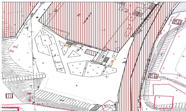
Схема размещения мест для продажи товаров на новогодней городской ярмарке по адресу: г. Железнодорожск-Илимский, ул. Янгеля, район № 16

Глава муниципального образования «Железнодорожск-Илимское городское поселение» А.Ю. Козлов