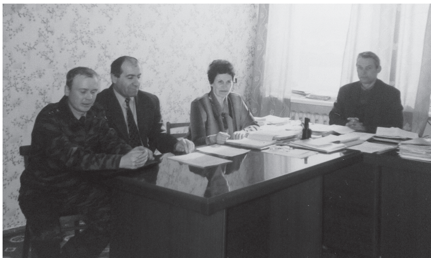
КДН Жигаловского района 1999-2003 годы

В администрации Иркутской области с 1992 года функционировала межведомственная комиссия по делам несовершеннолетних при администрации области. Председателями