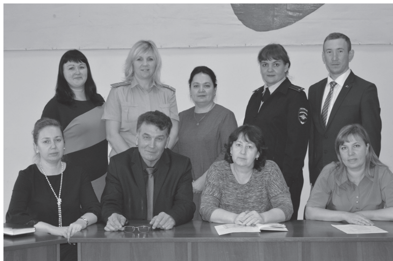
КДН и ЗП Жигаловского района в настоящее время