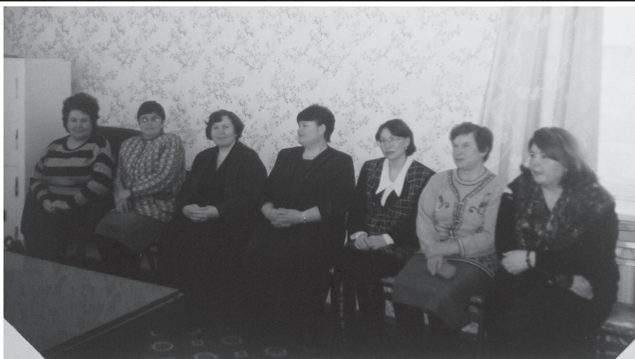
КДН Жигаловского района 1999-2003 годы