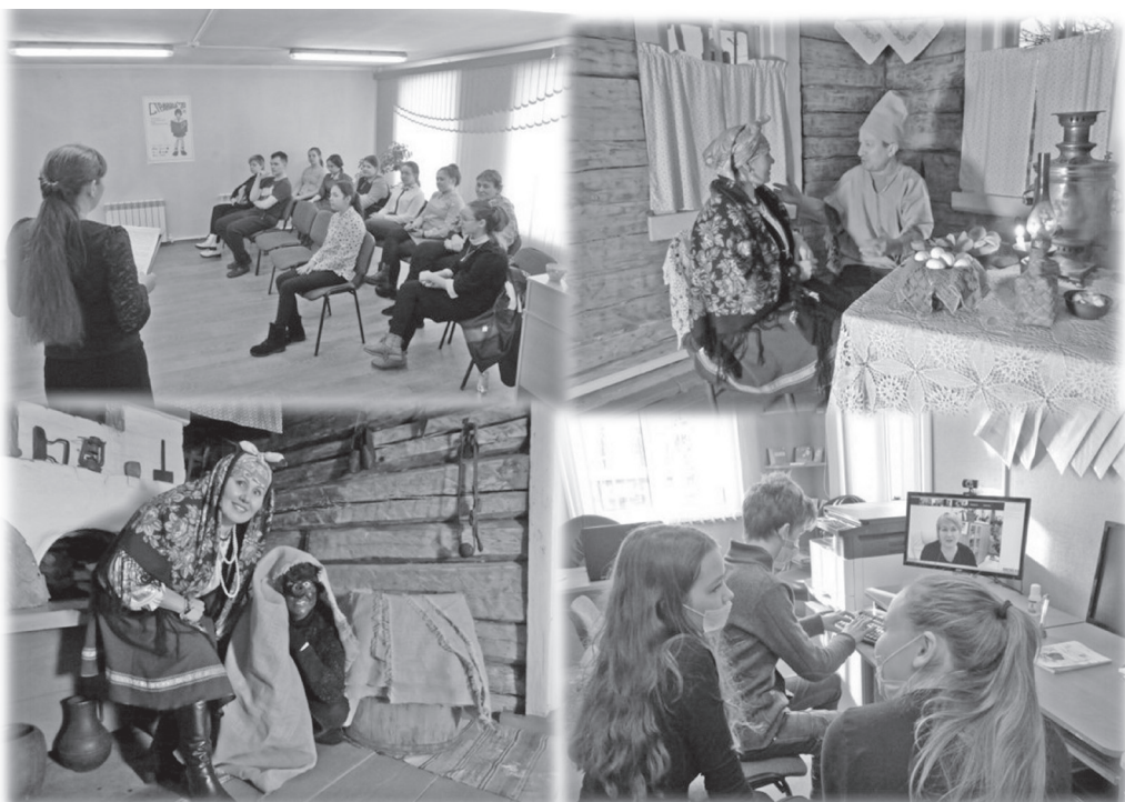
Мероприятия МКУК Межпоселенческая центральная библиотека