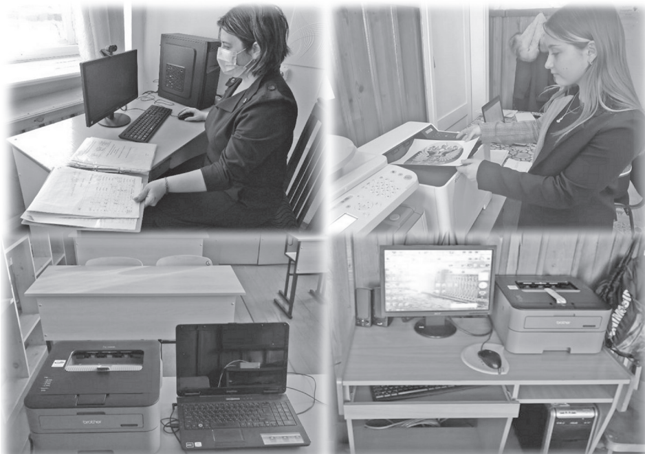
Создание условий для дистанционного и электронного обучения

«Живи сердцем» стала победителем регионального конкурса социально значимых проектов Иркутской области в номинации «Сохранение национальной самобытности» с проектом фестиваль национальных культур «Родословие» и получила грант на проведение мероприятий в сумме 116