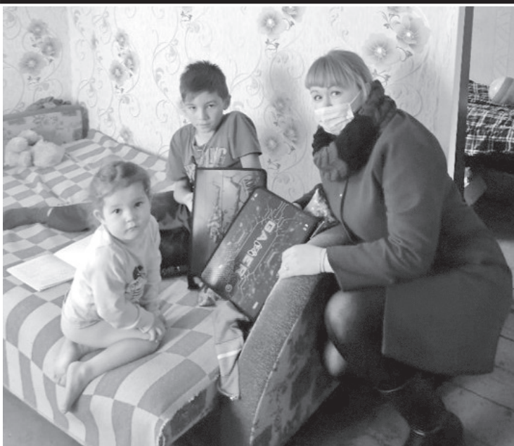
Развитие семейной политики

приобретено медоборудование для ОГБУЗ Жигаловская РБ на 250 тыс. рублей.