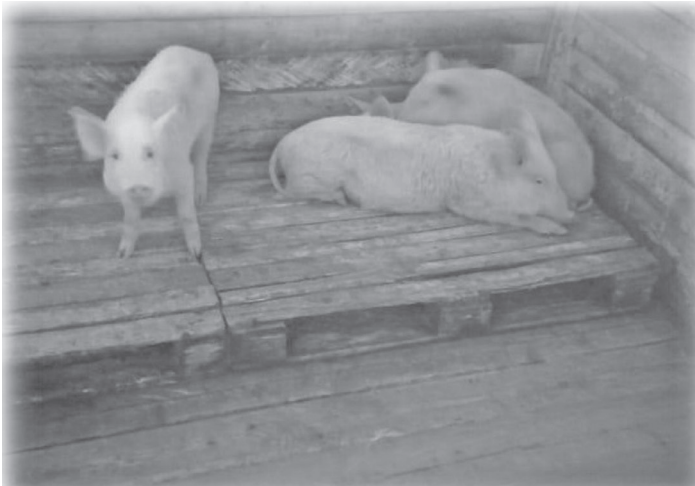
Построен свинарник для ООО «Еланское»

Выдано разрешение на ввод объекта в эксплуатацию после реконструкции автомобильной дороги Жигалово-Казачинское на участке км 87 – 107 в Жигаловском районе