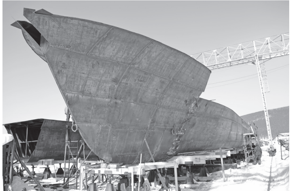
Корпуса двух теплоходов, которые уже в этом году планируют завершить

- Это государственный заказ, заказчиком которого является ФКУ «Речводпуть». Для нас работа очень интересна, ведь это новый проект. На первом теплоходе мы отработывали сборку корпуса,