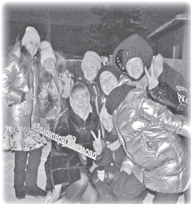
Жигаловская районная общественная организация по оказанию помощи незащищенным слоям населения и духовно – нравственному воспитанию общества «Живи сердцем»

Увеличение количества муниципальных закупок на 34%. Подготовлено и размещено на сайте госзакупок - 211 закупок на сумму 106 млн. рублей.