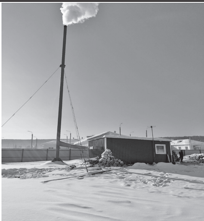
Введена в эксплуатацию котельная мощностью 0,45 МВт для детского сада на 120 мест