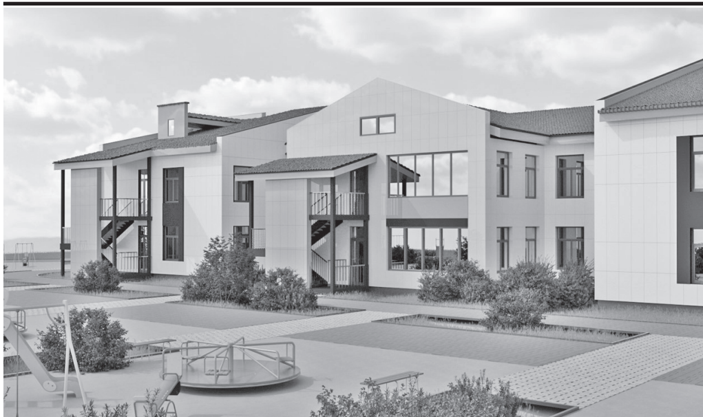
Разработана проектная документация на строительство детского сада на 240 мест в Жигалово

Общая успеваемость по итогам учебного года составила 94%.