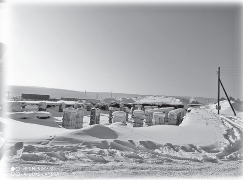
Физкультурно-оздоровительный комплекс в р.п. Жигалово

Стоимость строительства 122 971 тыс.руб.