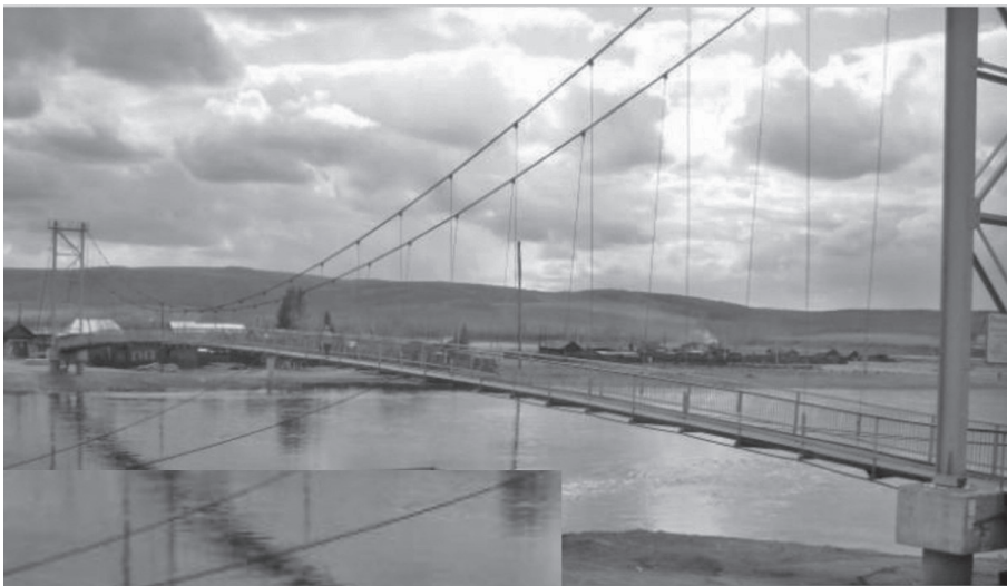
Проектная документация пешеходного моста через р. Лена у с. Тутура на стадии получения положительного заключения государственной экспертизы

В мероприятиях ТРЦ приняли участие 1350 обучающихся школ и воспитанников детских садов.