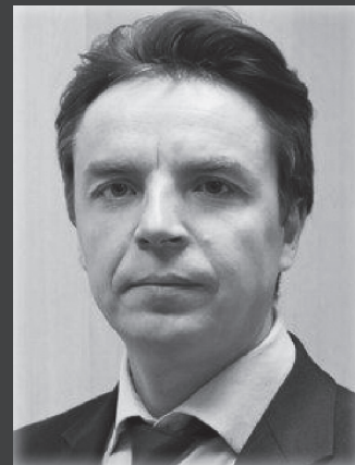
Мэр Нижнеилимского района М.С. Романов

Учредители: Дума и администрация муниципального образования «Железногорск-Илимское городское поселение»