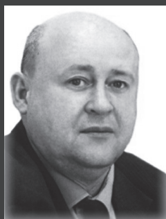
Глава г. Железногорск-Илимский А.Ю. Козлов

Глава муниципального образования «Железногорск-Илимское городское поселение» А.Ю. КОЗЛОВ