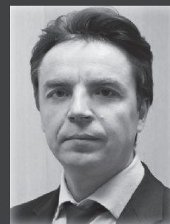
Мэр Нижнеилимского района М.С. Романов

Уважаемые жители! Приглашаем принять участие 25 января 2020 г. в РДК «Горняк» 14:00 во встрече с жителями о результатах деятельности.