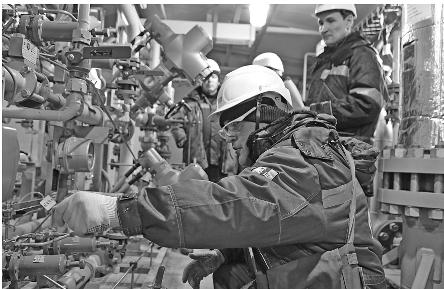
Теоретический этап конкурса

ООО «Газпром добыча Иркутск» — 100-процентное дочернее предприятие ПАО «Газпром». В 2011 году компания назначена оператором по разработке Ковыктинского газоконденсатного месторождения, которое является