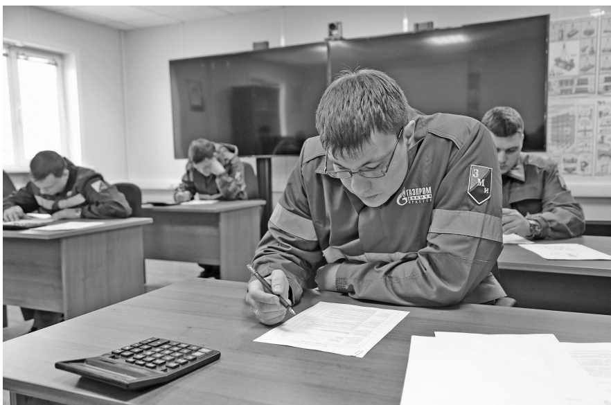
Практический этап конкурса

По традиции конкурс состоял из теоретического и практического этапов. Первое испытание — тестирование знаний технологий производства в газовой промышленности, требований охраны труда, промышленной и пожарной безопасности, правил оказания первой доврачебной неотложной помощи пострадавшим от несчастных случаев на производстве. Затем претенденты на победу провели чтение сборочного чертежа входного сепаратора блока компрессоров и рассчитали величину утечки газообразного испытательного флюида из межколонного пространства скважины.