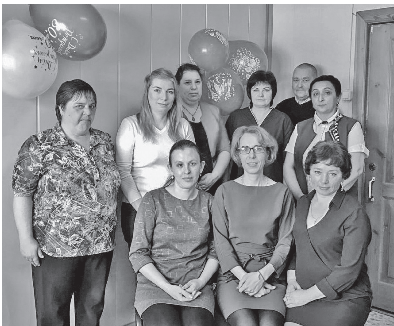
Коллектив ЦЗН Жигаловского района

19 апреля 1991 года был принят Закон Российской Федерации «О занятости населения в Российской Федерации». С этого момента по всей стране создаются Бюро занятости населения.