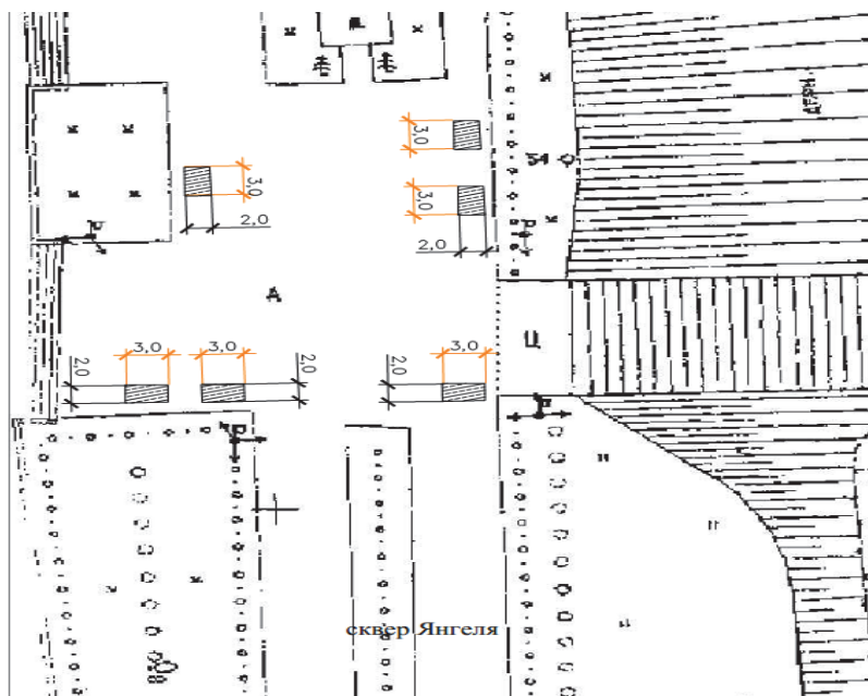
Схема размещения мест для продажи товаров на новогодней городской ярмарке по адресу: г. Железногорск-Илимский, район сквера имени М.К. Янгеля

Глава муниципального образования «Железногорск-Илимское городское поселение» А.Ю. Козлов