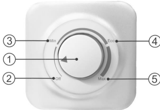
Рисунок 2. Механическая панель управления

Рисунок 2: 1 – ручка управления водонагревателем со стрелкой индикатором, 2 – зона «off» включения/выключения водонагревателя, 3 – зона регулировки температуры «min», 4 – зона регулировки температуры «eco», 5 – зона регулировки температуры «max».