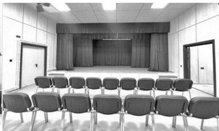
Дом культуры в деревне Пономарево