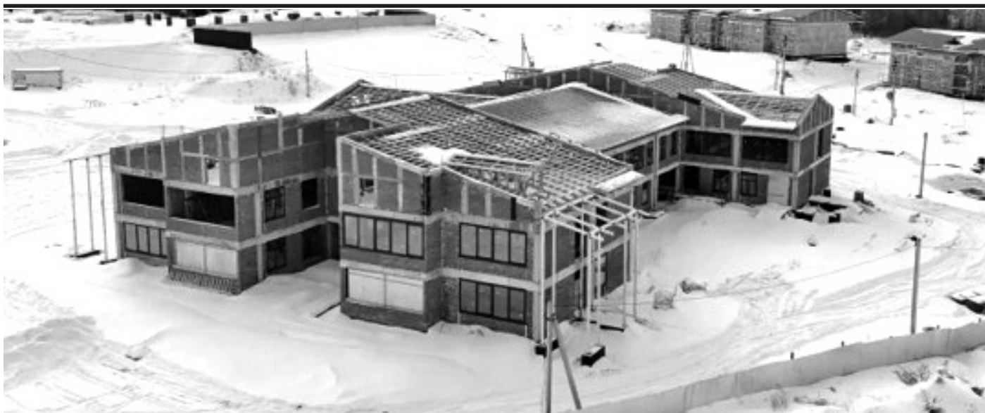
Продолжается строительство «Детского сада на 240 мест в р.п. Жигалово, ул. Полевая, 11»

программой «Молодежная политика Жигаловского района» на 2020 – 2026 годы. Проводятся мероприятия по патриотическому воспитанию, профилактике социально-негативных явлений, организации досуга молодежи и повышению ее социальной активности.