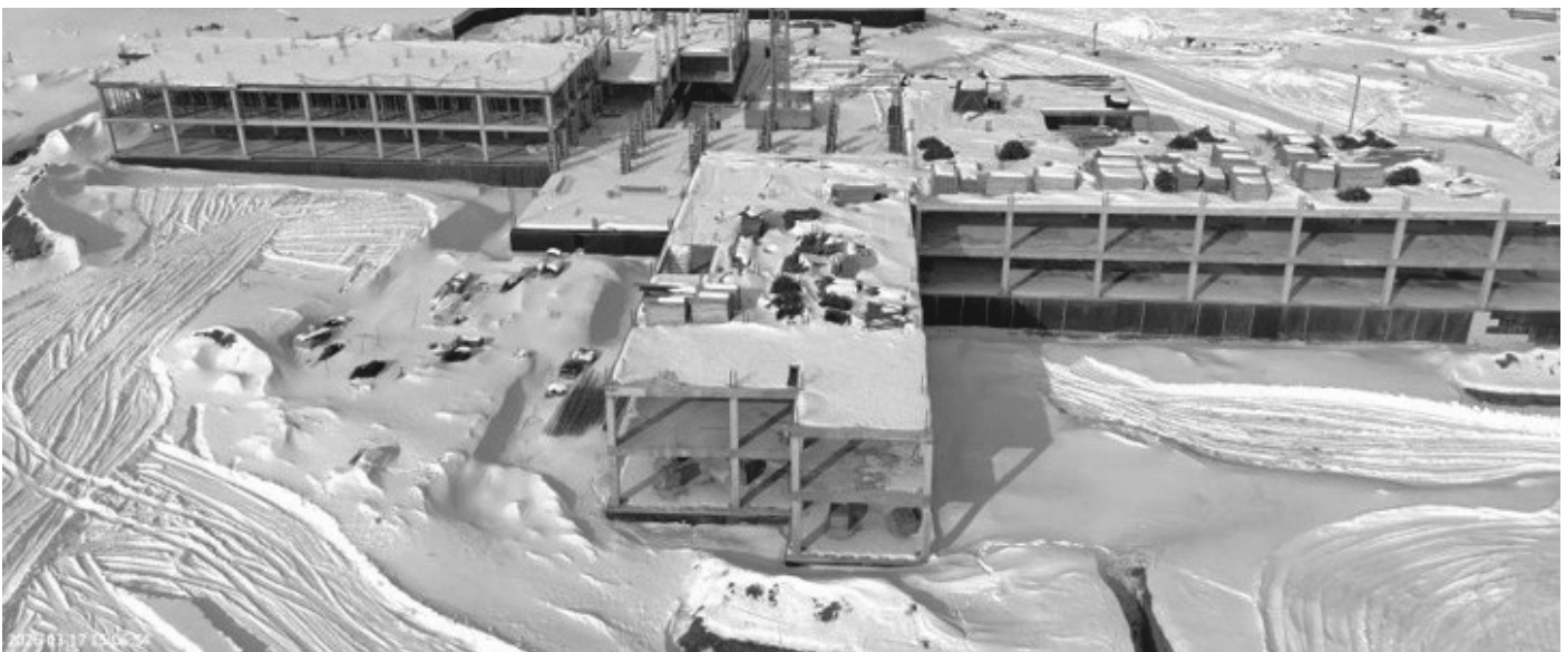
Строительство «Школы на 520 учащихся в р.п. Жигалово, ул. Полевая, 13»

Работа с молодежью на территории Жигаловского района проводится в соответствии с муниципальной