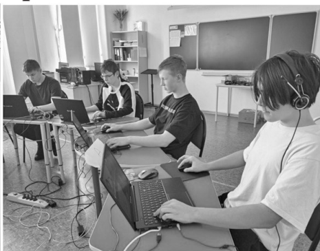
Районный конкурс по робототехнике