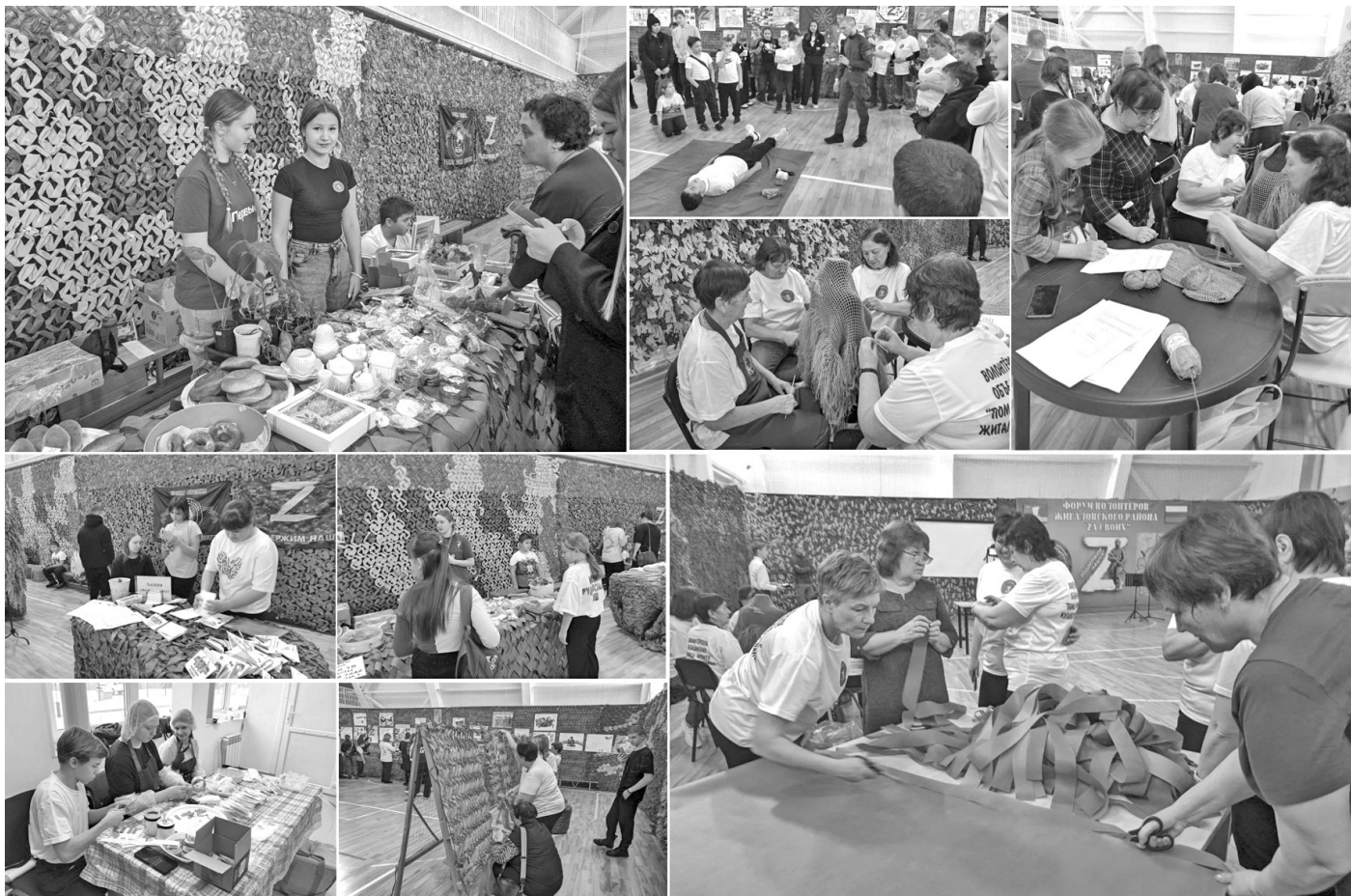
Работа Волонтерского объединения «Помощь фронту Жигаловский район»

Популярными и востребованными становятся гранты на реализацию социально-значимых проектов социально ориентированными некоммерческими организациями (СОНКО) и организациями