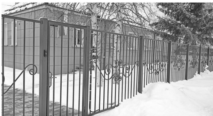
Проведен капитальный ремонт детского сада №6 в селе Чикан