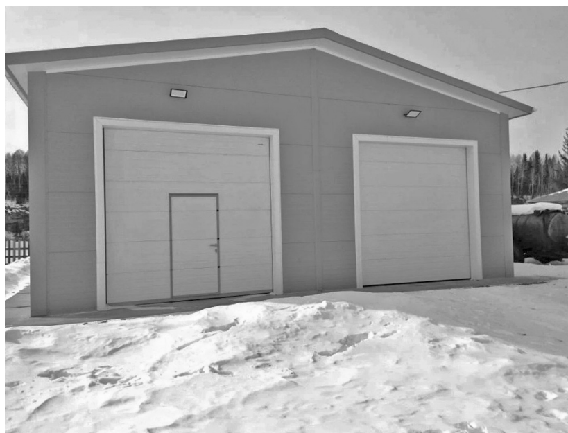
Приобретены гаражи для хранения техники, в том числе пожарной, в сёлах Знаменка и Лукиново

Ежегодное обновление тепловых сетей и источников теплоснабжения значительно снизило угрозу возникновения чрезвычайных ситуаций, связанных с авариями на объектах ЖКХ. В 2025 году серьезных аварий на объектах теплоснабжения не произошло.