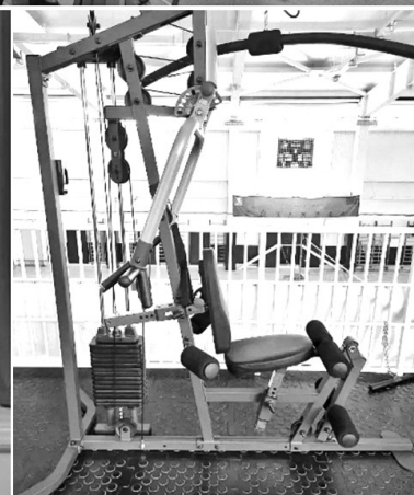
Обновление материально-технической базы учреждений образования