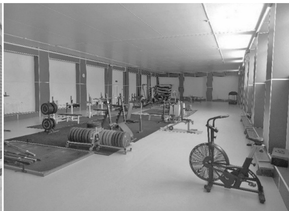
Капитальный ремонт спортивного зала ДЮСШ «СИЛА СИБИРИ»

Капитальные вложения в объекты муниципальной собственности составили 157 млн.700 тыс. рублей. Проведены капитальные ремонты и разработка проектно-сметной документации. 15 сентября после капитального ремонта принял своих воспитанников детский сад №6 села Чикан. Проведены работы по благоустройству территории детского сада №10,