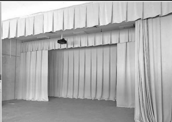
Дом культуры в деревне Головновка

педагог-организатор» и регионального конкурса среди молодых педагогических работников образовательных организаций Иркутской области «Новая волна».