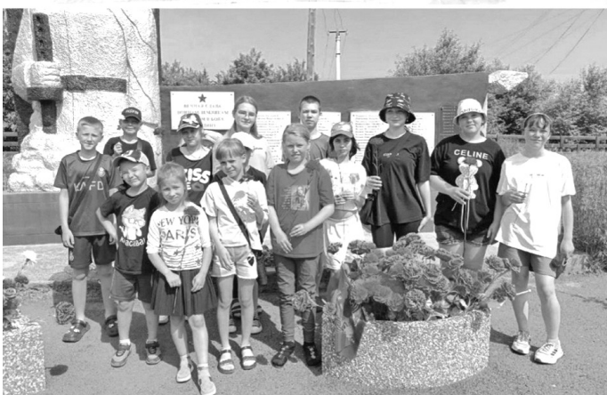
Организация летних каникул