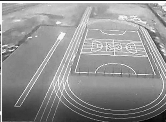
Капитальный ремонт стадиона в Рудовской школе