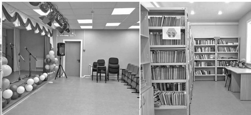
Дом культуры в деревне Нижняя Слобода

профессиональное учебное заведение по 230 тыс. рублей и 1 педагогу, окончившему высшее учебное заведение - 345 тыс. рублей.