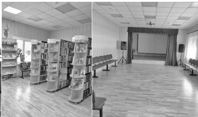
Капитальный ремонт Дальнезакорского Дома культуры