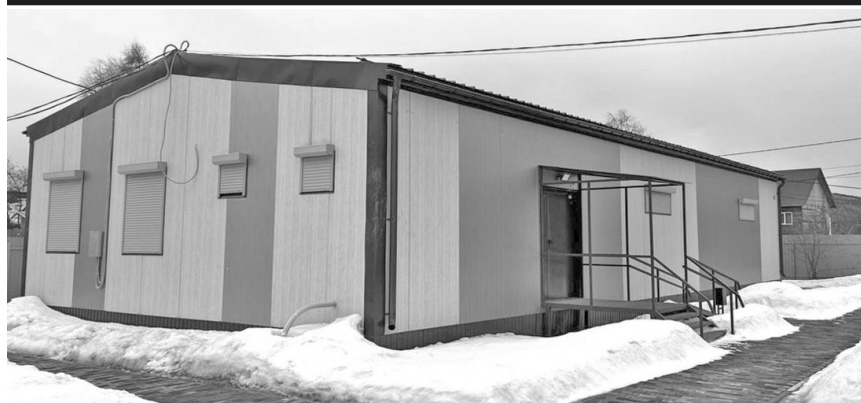
Приобретено модульное здание Архива в рп. Жигалово, ул. Левина, 1