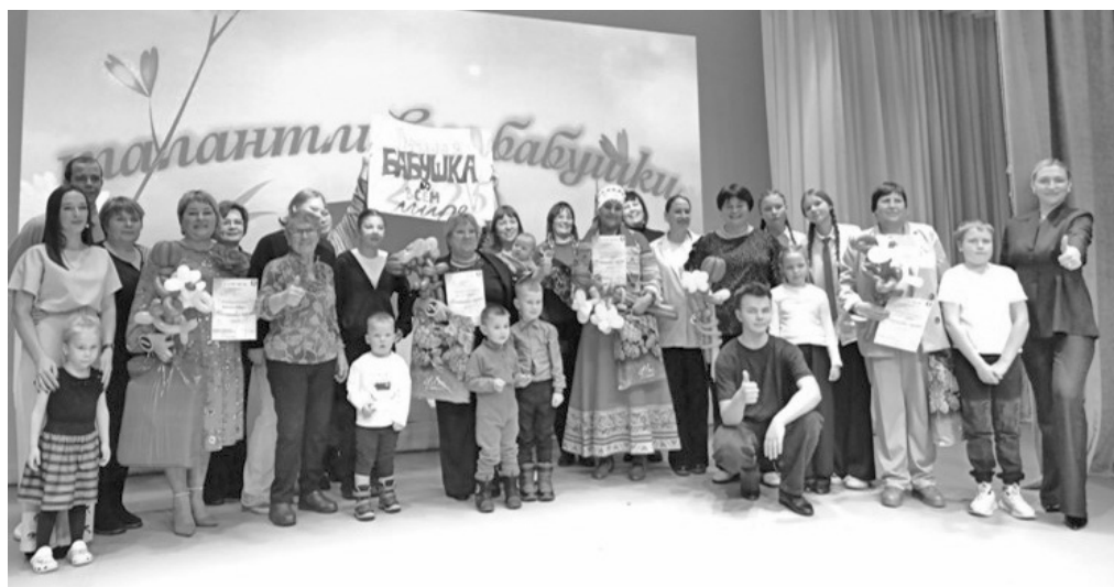
Советом женщин организован конкурс «Талантливая бабушка»

За отчетный период проводились мероприятия: «Сохрани ребенку жизнь!», «Каждого ребенка за парту!», «Безопасное лето», «Подари ребенку шоколадку!», «День правовой помощи детям», «Алкоголь под контроль». Проведен профилактический тренинг