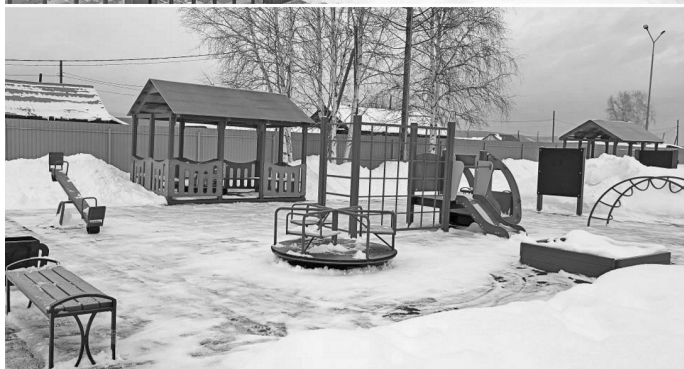
Благоустроена территория детского сада №10 в селе Рудовка

«Подросток в мире эмоций». В парке Петра и Февронии прошли «Большие семейные выходные», проведена квест-игра «Здоровая молодежь». Проведен районный конкурс социальной рекламы «Защити нас, комендантский час!», Фестиваль «Многодетная семья – талантами сильна». Совместно с представителями