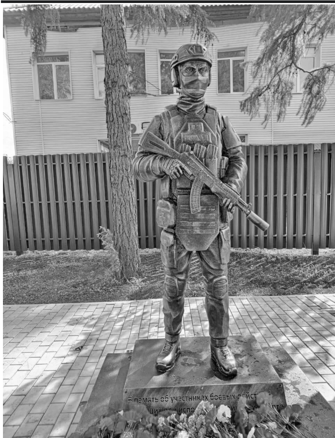
Открыт памятник Участникам боевых действий, погибшим при исполнении воинского долга

В 2025 году завершены муниципальные проекты: