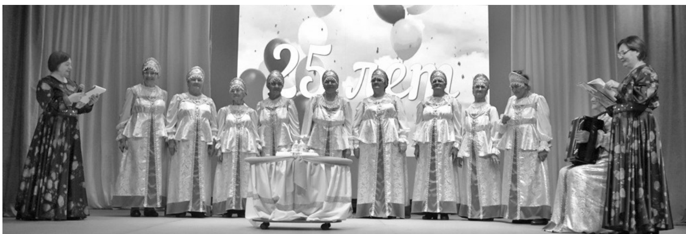
Вокальный коллектив «Ветераночка»

Продолжилась реализация проекта «Молодые профессионалы» , в рамках данного проекта в 2025 году запланировано и освоено 1 млн. 126 тыс. рублей. По договорам целевого обучения продолжили