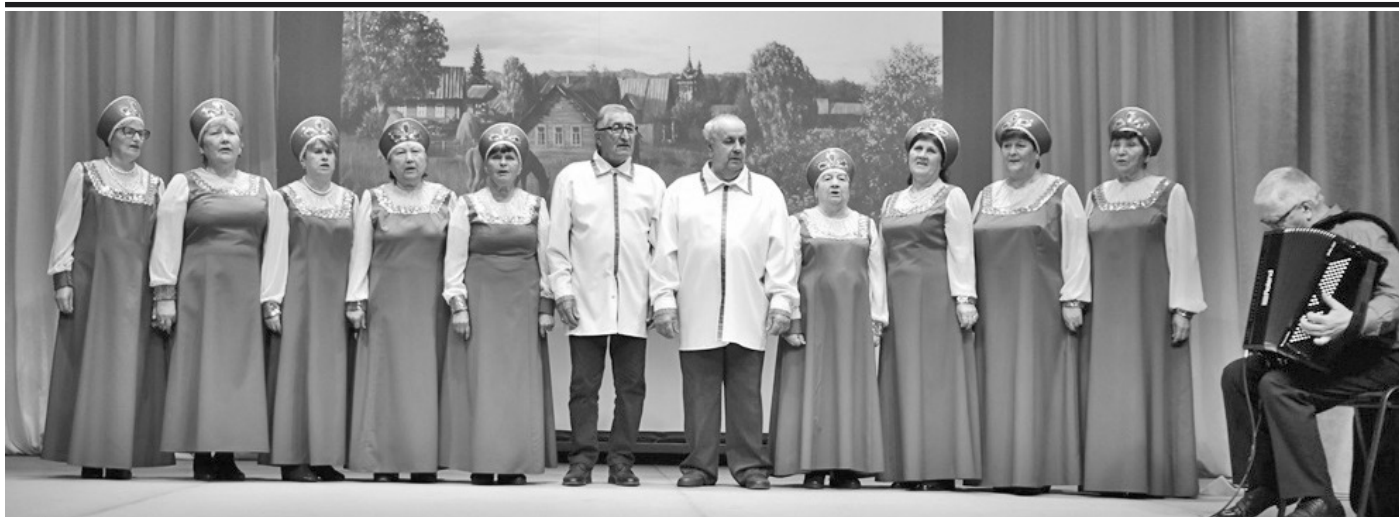
Народный хоровой коллектив ветеранов «Вдохновение»