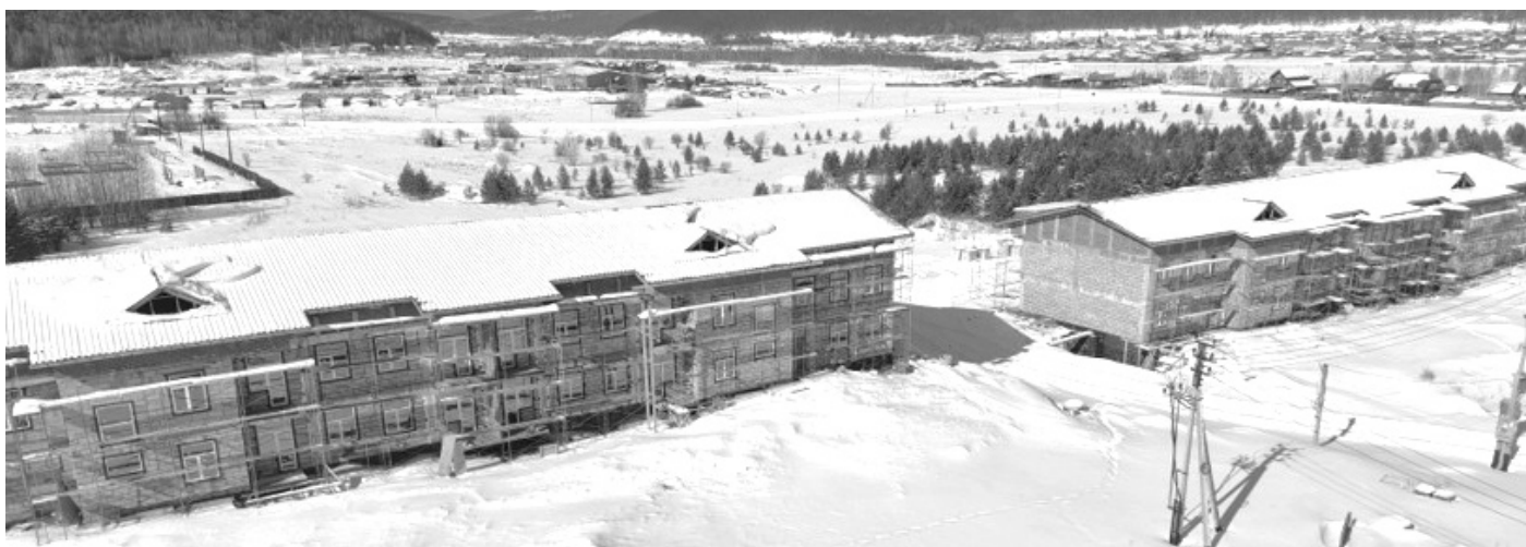
Строительство «Двух жилых домов на 24 квартиры в р.п.Жигалово, ул.Полевая, 10, 12»

Впервые в 2025 году в Жигаловском районе прошла спартакиада Пенсионеров, в которой приняло участие 6 команд. Участники состязались в соревнованиях по настольному теннису, смешанному передвижению, дартсу, шашкам. В 2026 году спартакиада запланирована на апрель.