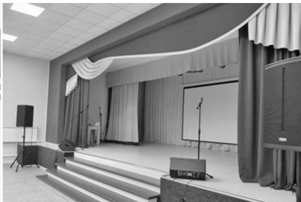
Дом культуры в селе Знаменка