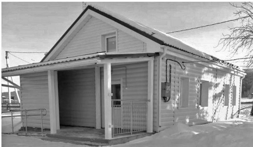
Проведен капитальный ремонт здания мастерских Петровской школы

Фактическое исполнение в рамках реализации мероприятий Программы «Развитие образования» в 2025 году составило 1 млрд. 196 млн. 543 тыс. рублей, в том числе местный бюджет – 573 млн. 266,8 тыс. рублей.