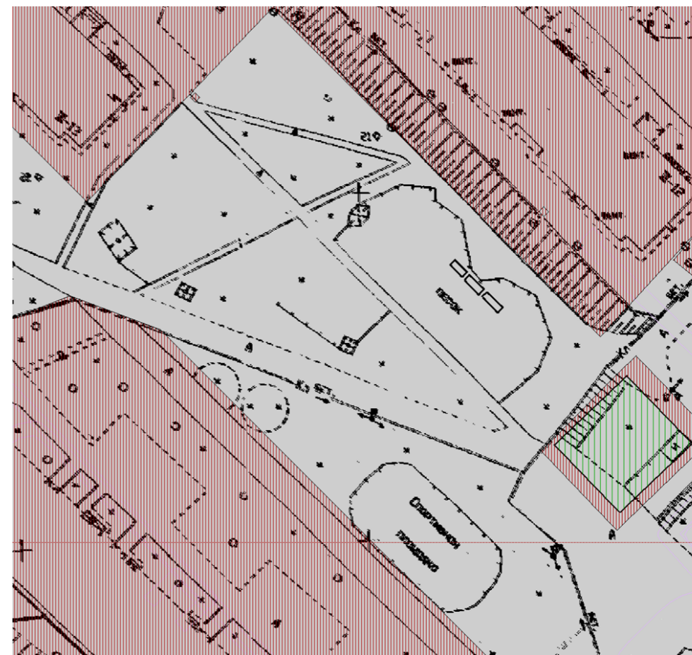
Схема размещения мест для продажи товаров на ярмарке в период проведения празднично-игровой программы «Валенкобол»

И.о. Главы муниципального образования «Железногорск-Илимское городское поселение»