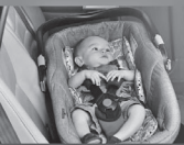
Автокресло «лялька» группы 0 (для детей массой < 10 кг)*

При покупке детского удерживающего устройства обязательно следует уточнить у продавца наличие сертификата на товар!