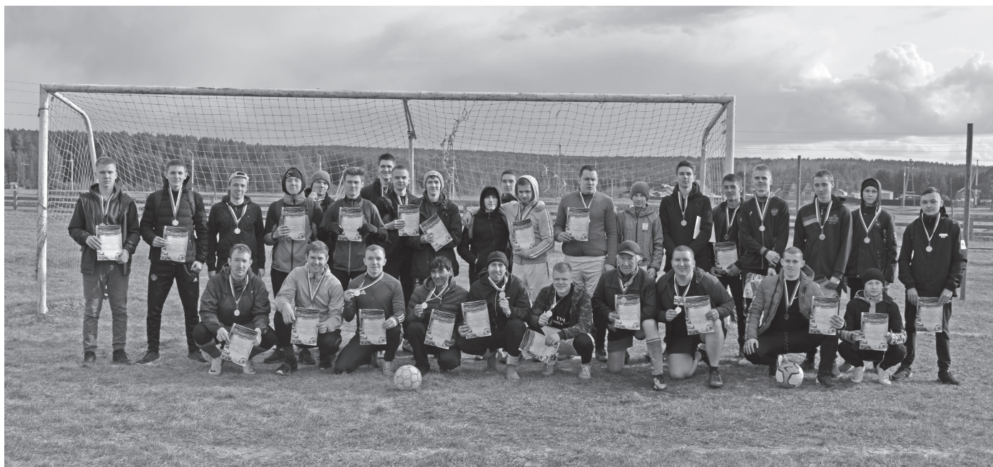
Открытие летнего спортивного сезона