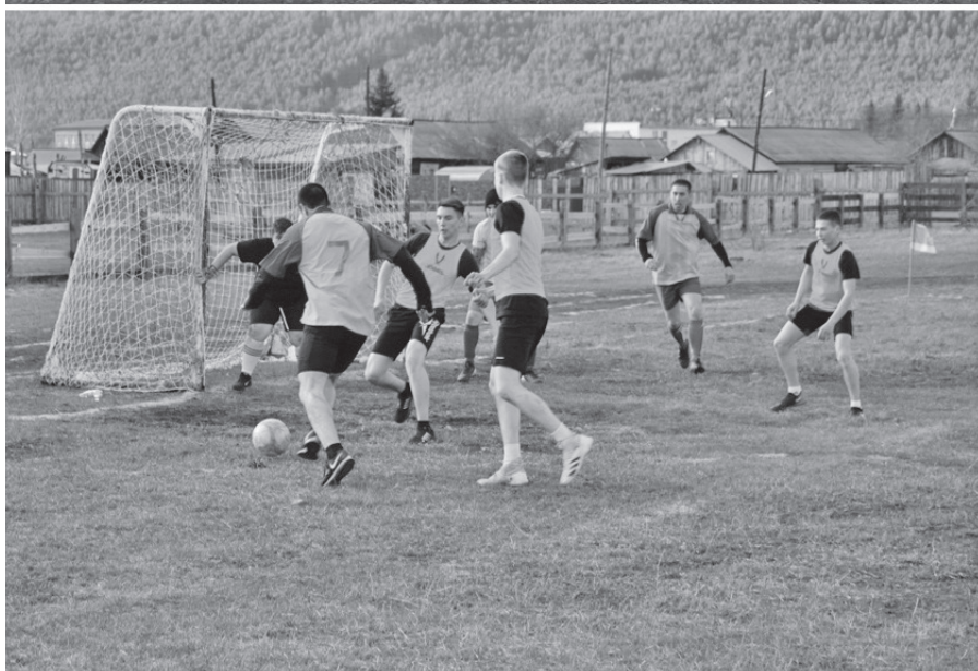
Турнир по мини-футболу «Весна-2021»