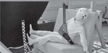
Результаты тестов использования небезопасных удерживающих устройств*

Дополнение определения «направляющая ляжка» в Правилах ЕЭК ООН № 44-04 было одобрено Всемирным Форумом (WP.29). Внесенная поправка к формулировке указывает на то, что «направляющая ляжка» рассматривается как составной элемент детской удерживающей системы и НЕ может отдельно официально утверждаться в качестве детской удерживающей системы в соответствии с настоящими Правилами». Это исключает даже формальную возможность сертификации устройств типа «направляющая ляжка»!