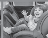
Автокресла группы I (для детей массой 9-18 кг)*