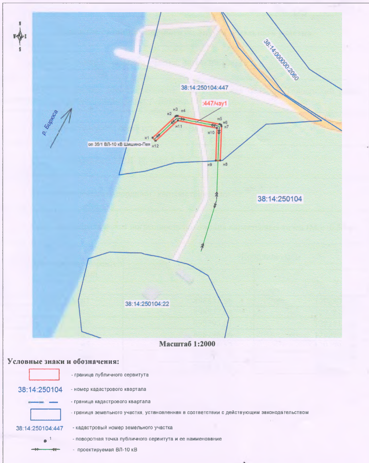
Схема границ публичного сервитута части земельного участка на кадастровом плане территории