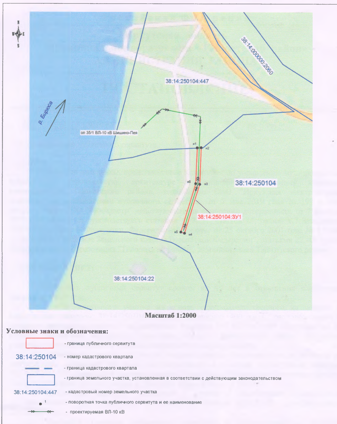
Схема границ публичного сервитута на кадастровом плане территории