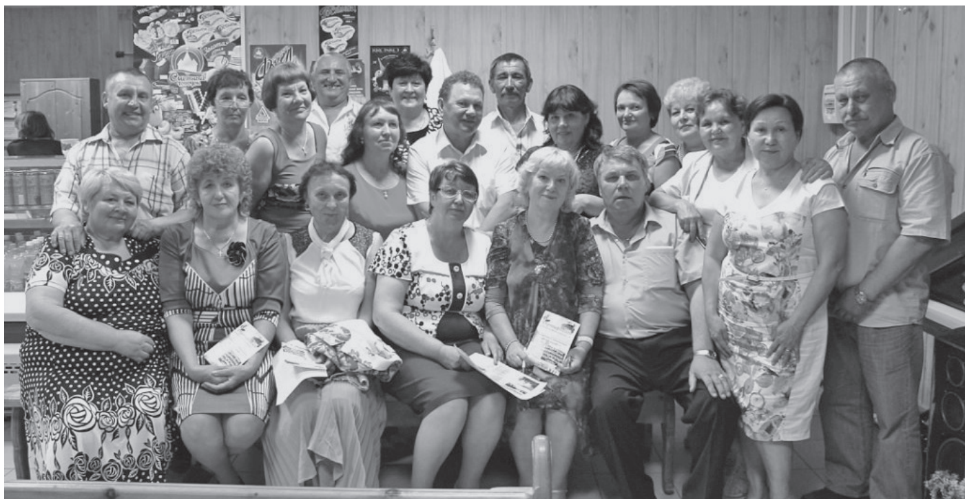
Встреча выпускников Тутурской средней школы