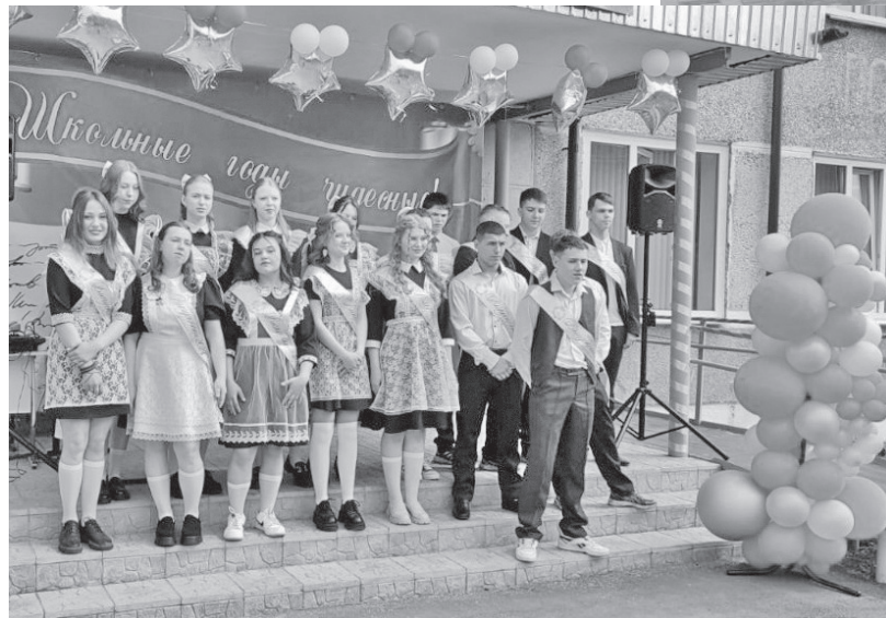
Жигаловская школа №2