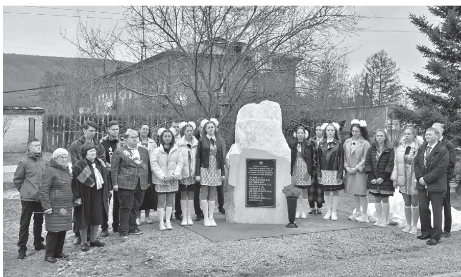
Открытие памятника на «Аллее памяти» в Жигаловской школе №1

Прозвенели последние звонки, впереди государственная итоговая аттестация. Экзамены - это проверка не только знаний, но и готовности к будущей жизни. Работа с большим потоком информации, решение сложных задач, упорная работа над собой - все это проверка на прочность. Справиться с тревожными эмоциями полностью невозможно, но важно взять себя в руки: вы готовились, а значит, все сможете! Помните, что экзамен – это не сама цель, средство ее достижения. Успехов вам, у вас все получится!