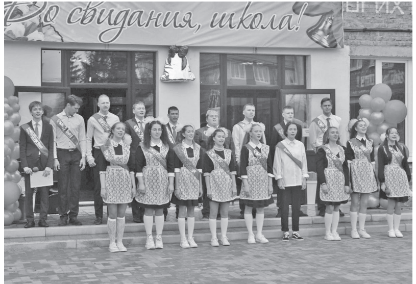
Жигаловская школа №1

«Последний звонок» – общешкольный праздник, который адресован выпускникам, учителям и родителям. «Последние звонки» проходят, когда учеба уже закончилась, а экзамены еще не начались. Это время прощания со школой.