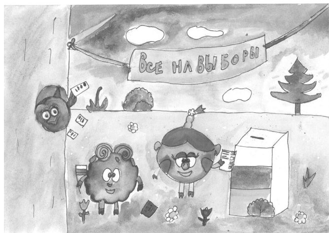
Рисунок Евгении Чупановской

Рисунки принимаются не позднее 16 марта 2026 года по адресу: 666402, Иркутская область, Жигаловский муниципальный округ, п. Жигалово, ул. Советская, д.25, кабинет Жигаловской территориальной избирательной комиссии № 303 (3 этаж).