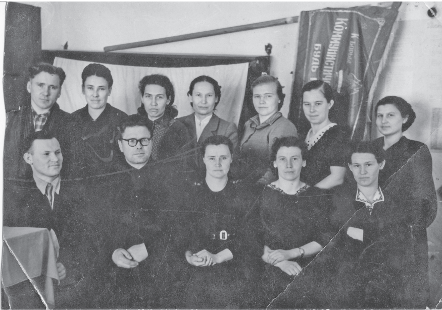
1959-1960 гг. Судоверфинская школа. п. Молодёжный