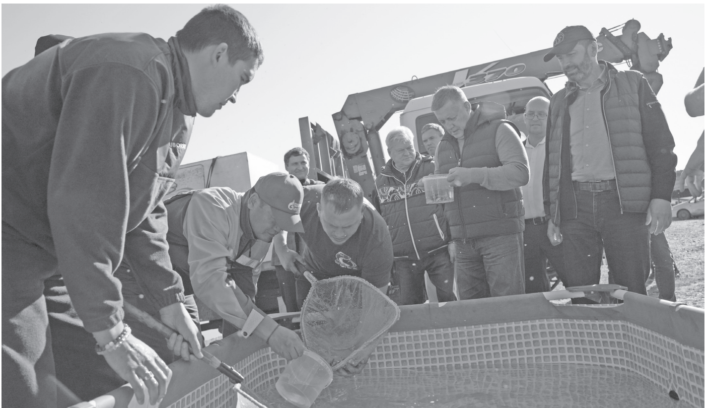
Выпуск молоди хариуса в реку Лена

Мальки хариуса, которых выпустили в реку Лену, были выращены на Бурдугузском рыбноводном заводе, расположенном в Иркутском районе. Отметим, всего в Иркутской области с 2011 года работают два рыбноводных завода, принадлежащих ООО