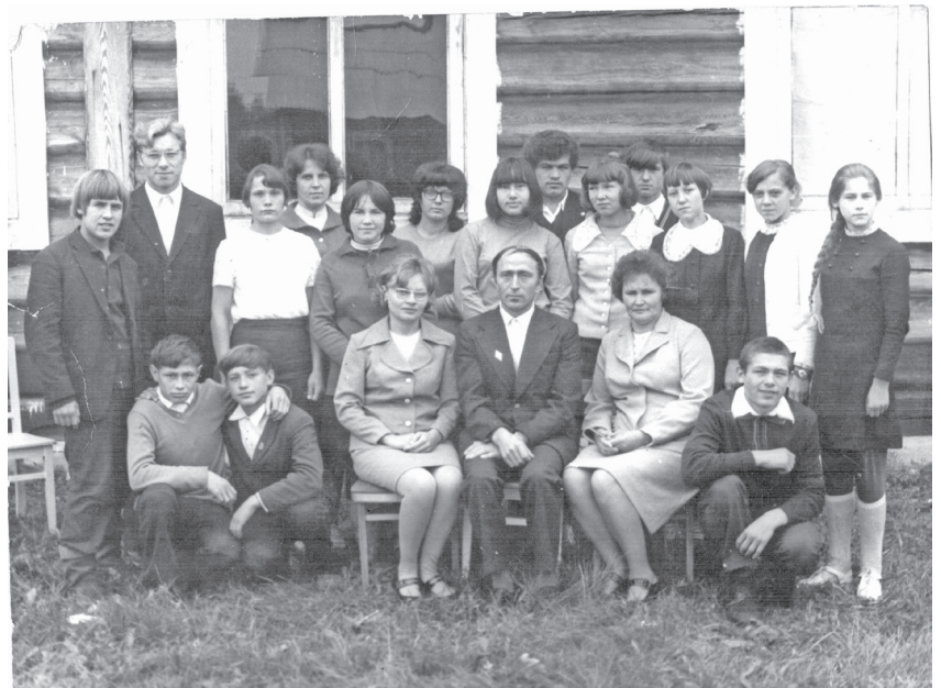
Учителя и ученики Усть-Илгинской школы