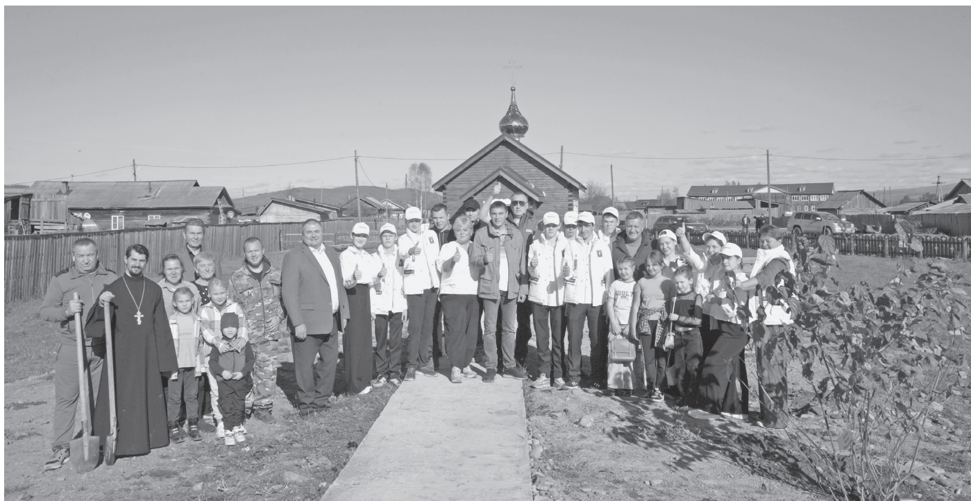
Высадка саженцев сирени возле храма святого Иннокентия, епископа Иркутского

Кроме того, Губернатор Игорь Кобзев посетил храм святого Иннокентия, епископа Иркутского,