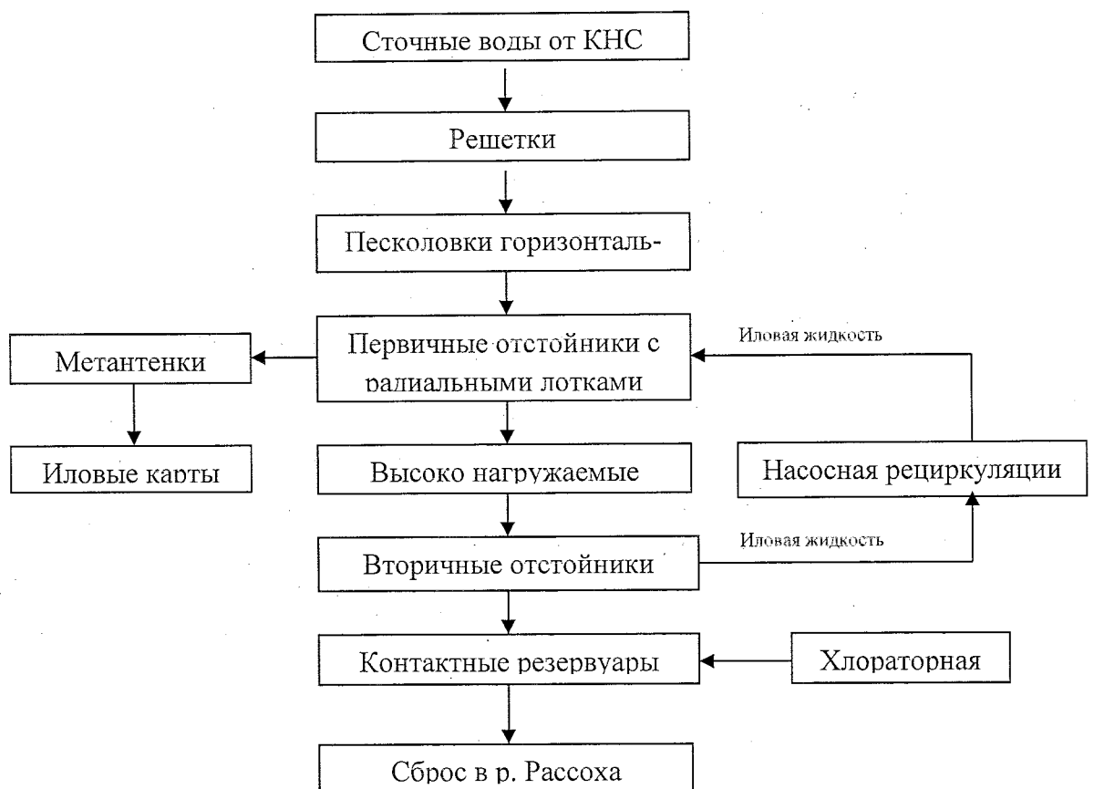
Рис.3.1.2.1. Схема КОС

Для обработки, обеззараживания осадка, содержащего в себе органические вещества, выпавшие в результате механической очистки сточной воды, служат два метантенка. Процесс перегнивания происходит без доступа воздуха – в аэробных условиях, осадок разрушается с выделением газа – метана. Обработка осадка происходит при мезофильном процессе с температурным режимом +330С