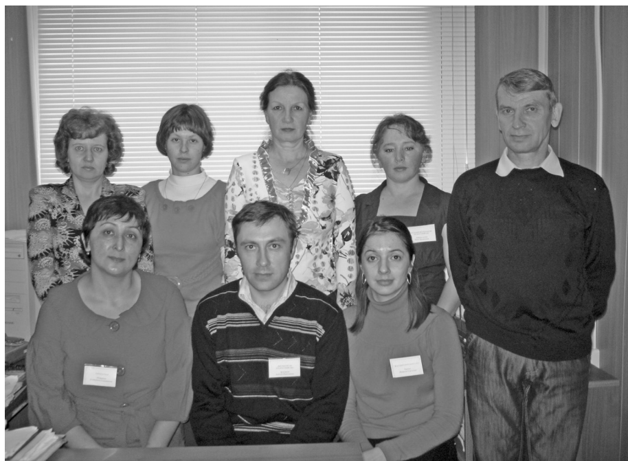
Коллектив Центра занятости в 2011 году

С 2019 года Центр занятости становится частью национального проекта «Демография» в части профессионального обучения граждан старшего поколения, затем участниками проекта становятся женщины, находящиеся в отпуске по уходу за ребенком