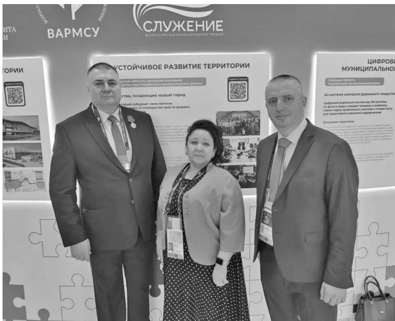
Делегация Жигаловского муниципального округа на Форуме

Мероприятие такого масштаба — это уникальная площадка для обсуждения стратегических задач развития муниципальных образований и обмена успешными управленческими решениями, возможность перенять лучшие практики, обсудить механизмы развития территорий.