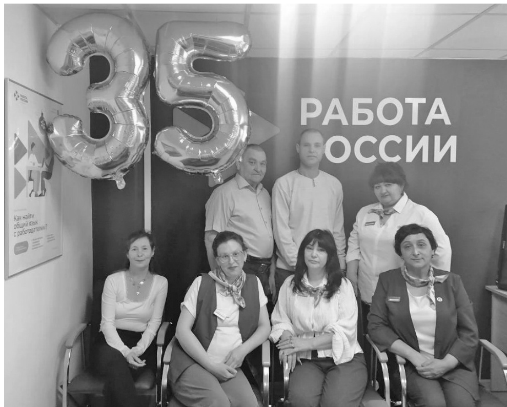
Коллектив Кадрового центра в настоящее время