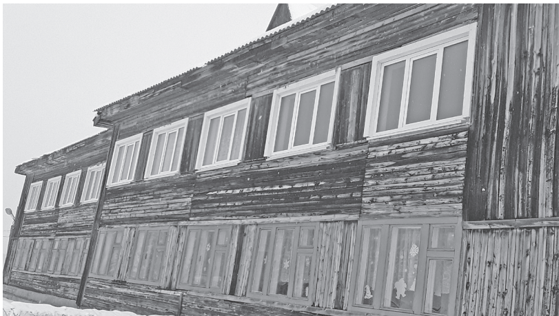
Интернат Рудовской школы

«Точка роста», отремонтированы санузлы. В 2022 году завершились ремонты кабинетов физики и химии, лаборантских, проведен текущий ремонт полов в трех кабинетах второго этажа, заменены пожарные двери, а в летний период обновлена крыша школы, материалы для этих работ были приобретены еще зимой.