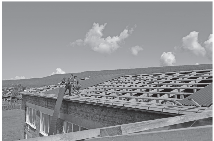
Жигаловская школа №1

В Чиканской средней школе завершены работы по замене новой кровли и водостоков на здании школы, в пришкольном интернате установлены