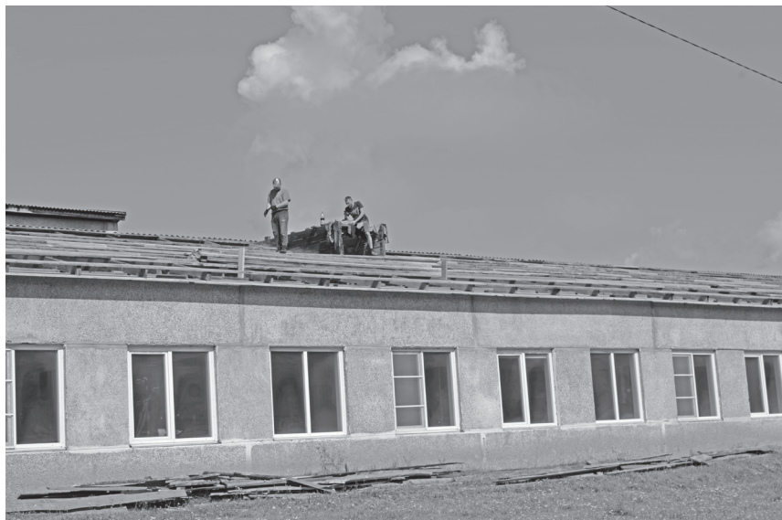
Жигаловская школа №2