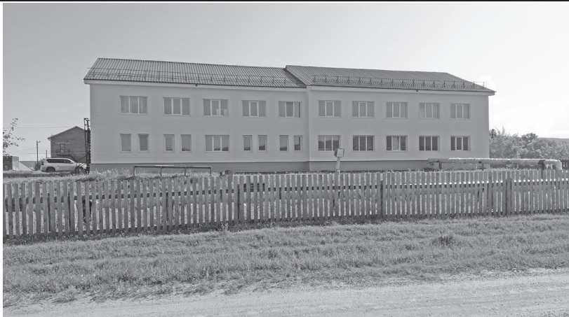
Интернат Рудовской школы

Масштабно проводятся ремонтные работы в Жигаловской школе №1. В прошлом году обновлены учебные кабинеты центра образования