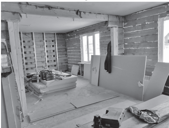
детский сад «Геолог»

6 территориях школ района: Рудовской, Чиканской, Дальнезагорской, школах №1 и №2 п.Жигалово и Детско-юношеской спортивной школы на сумму более 20 млн. рублей.