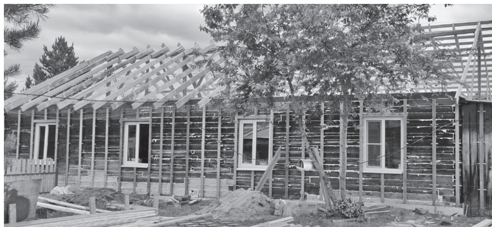
детский сад «Геолог»

Ведутся ремонтные работы в детском саду №1 «Березка». Частично отремонтирована крыша, вскрыты полы и заменены сгнившие балки и доски, отремонтированы стены в групповых помещениях, столовой, коридорах детского сада, обшиты и покрашены стены в туалетных помещениях.