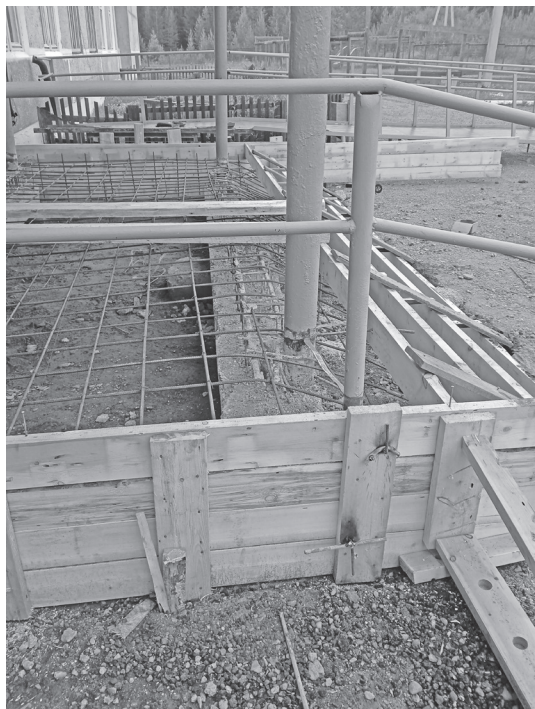
Жигаловская школа №2

В Детско-юношеской спортивной школе ведутся ремонтные работы в основном здании школы: заменены полы,