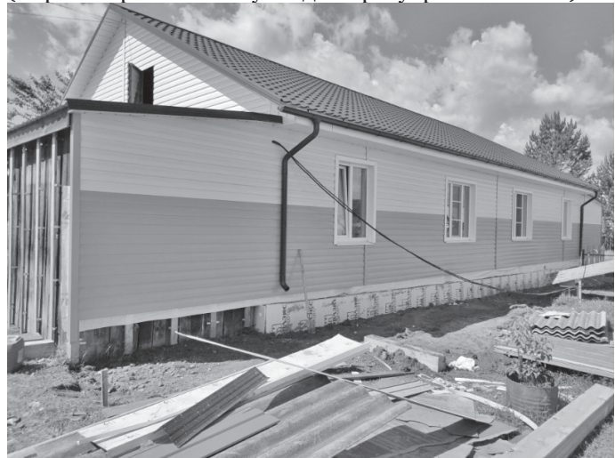
детский сад «Геолог»

Начаты работы по благоустройству (асфальтированию и укладке тротуарной плитки) на