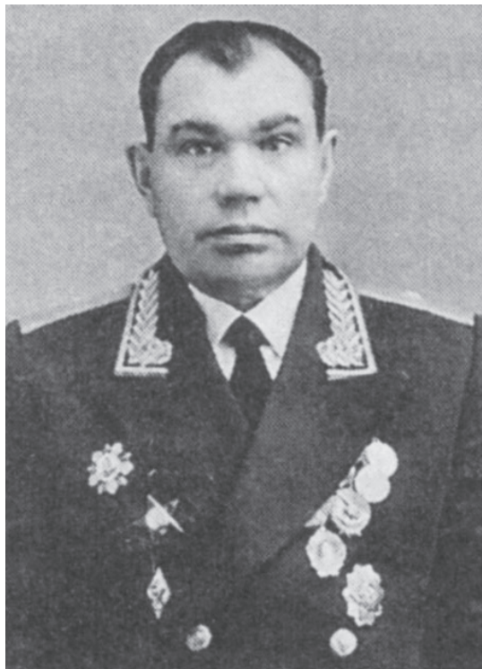
Филипп Анисимович Исаков

Улица Исакова названа в честь Филиппа Анисимовича Исакова 1906 – 1975 гг.