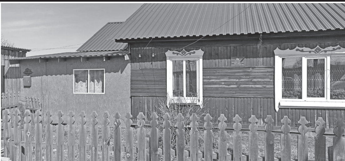
улица 40 лет Победы

Решением районной Думы №32 от 8 сентября 1998 года Жигаловской средней школе №1 присвоено имя Григория Галактионовича Малкова, а также распоряжением №94 от 6 июня 2006 года администрации Жигаловского городского поселения в честь