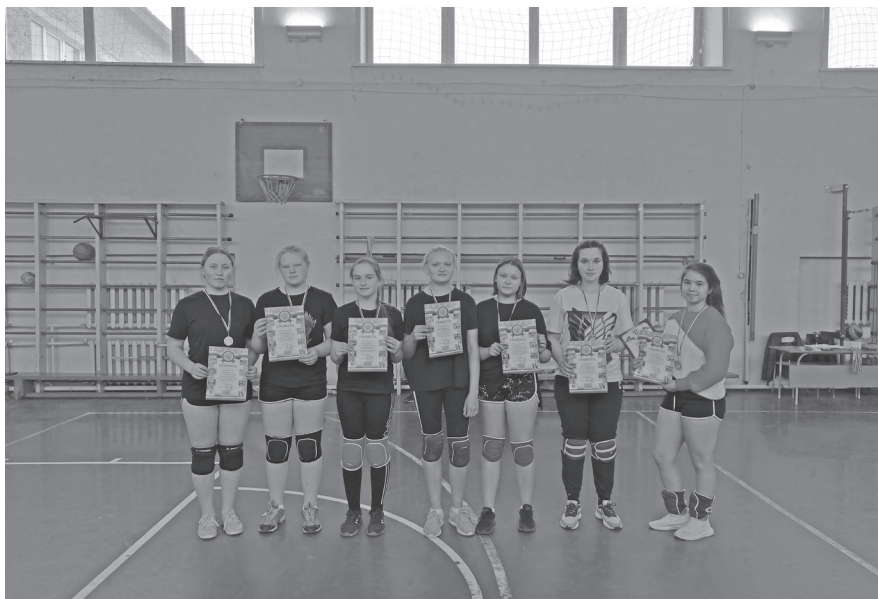
Команда «Дальняя Закора»

Слаженную и очень красивую игру продемонстрировали команды «Я-Волейболен» и «Дальняя Закора» борясь за I - II место, команда «Я-Волейболен» не дала ни единого шанса своим соперникам и одержала победу.