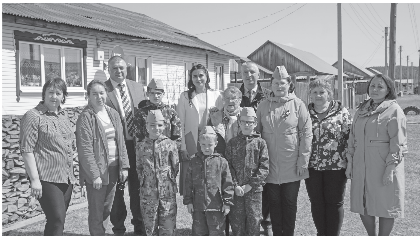
Участники торжественного открытия мемориальной доски на улице Малкова