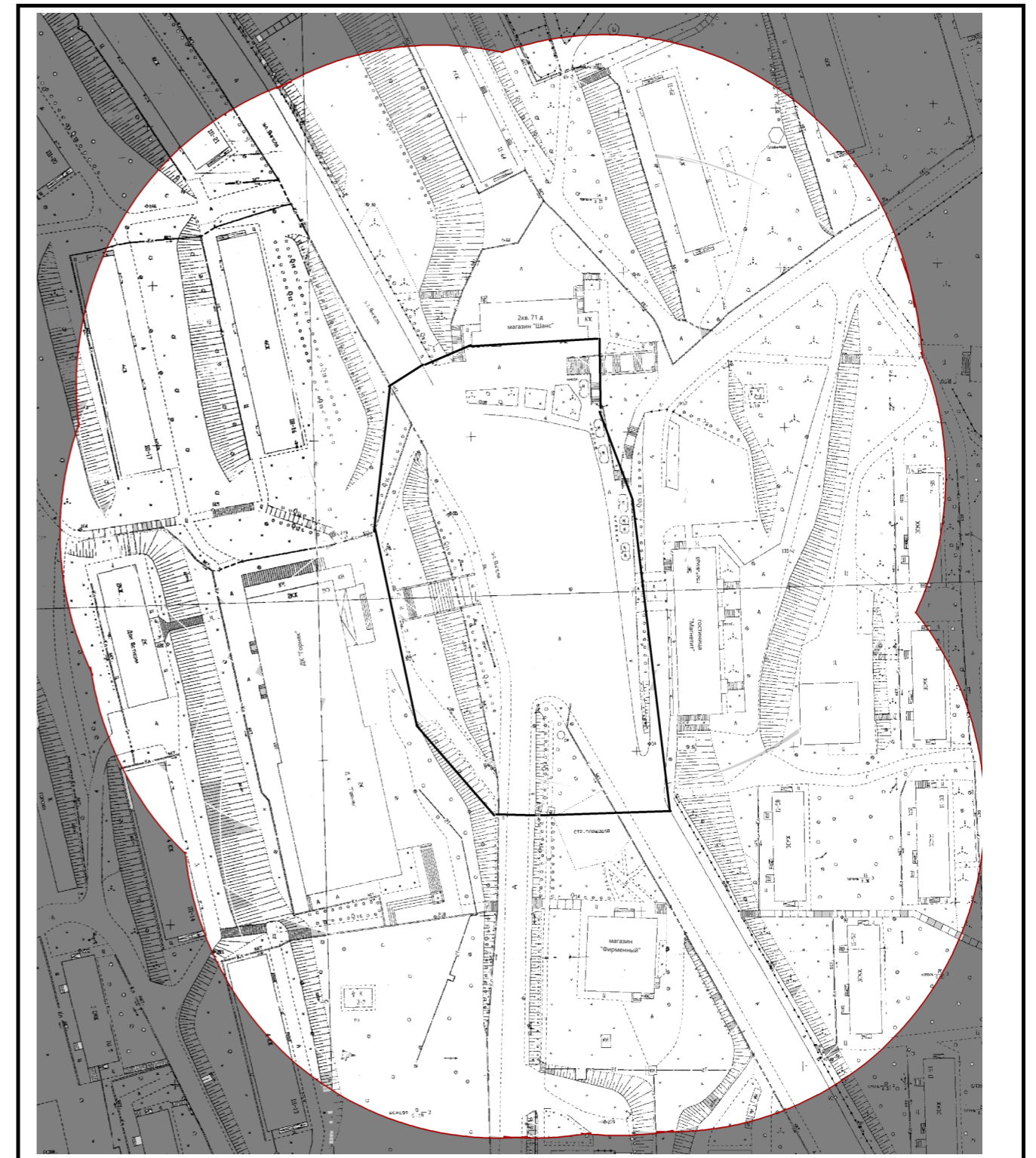
Схема границ распространения ограничений на розничную продажу алкогольной продукции

Глава муниципального образования «Железногорск-Илимское городское поселение»