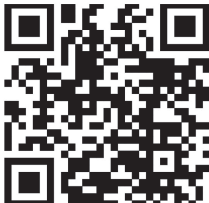
Страница в «Одноклассниках»