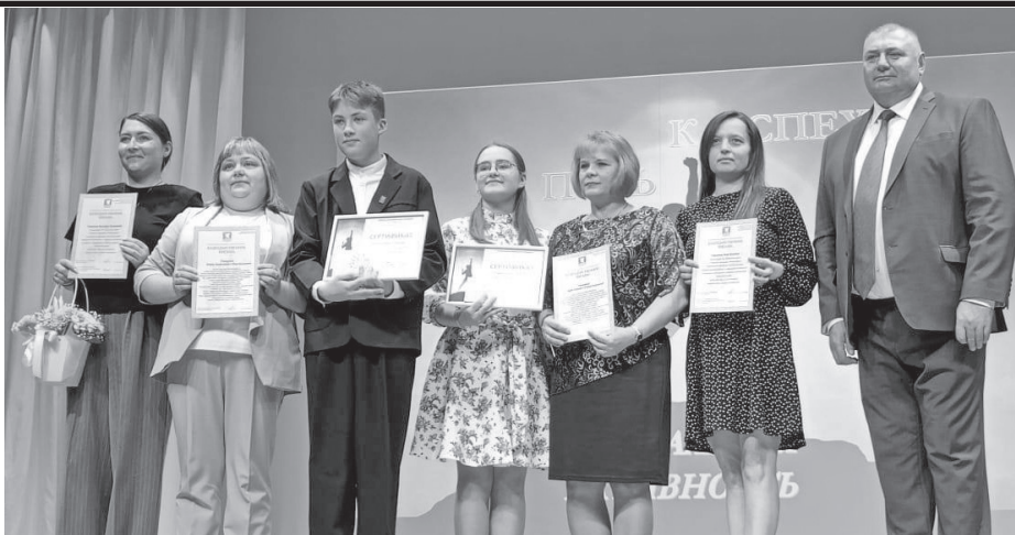
Номинация «Социальная активность»