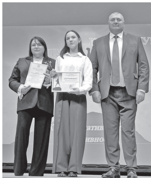
Номинация «Коммуникативность и креативность»

конференции «Из века в век», победитель муниципального этапа Всероссийской олимпиады школьников по литературе, обществознанию, основам безопасности и защиты Родины.