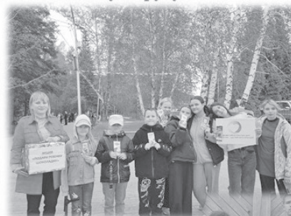
Акция «Подари ребенку шоколадку»