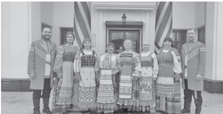
Народный вокальный ансамбль «Русская песня»