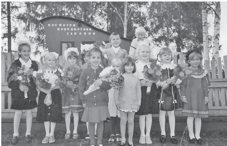
Учащиеся начальных классов Коношановской школы