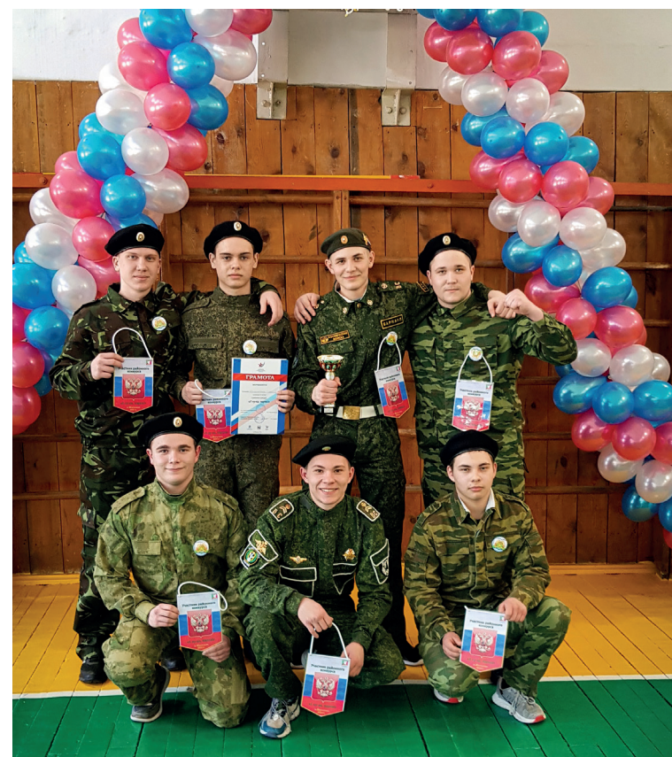
Команда победителей - Жигаловской школы №1

Уровень подготовки команд к конкурсу с каждым годом растет. Военная выправка, знаки отличия, костюмированное театрализованное представление, военно-техническое оснащение учебным оборудованием, владение знаниями в области основ военного дела сделали мероприятие незабываемым. К конкурсу готовятся, конкурс ждут! Все участники состязаний с честью и достоинством выдержали предложенные им трудные испытания, убедив нас в том, что на нашей земле растут настоящие защитники, способные проявить мужской характер, смелость, упорство, мужество.