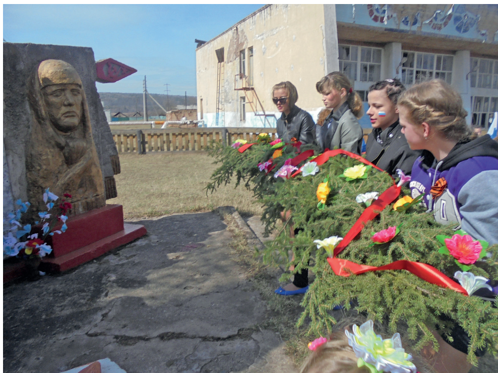
С уважением, администрация Рудовского муниципального образования и МКУ Рудовский КИЦ «Сибиряк»

С праздником Великой Победы! Мира Вам, добра и счастья!